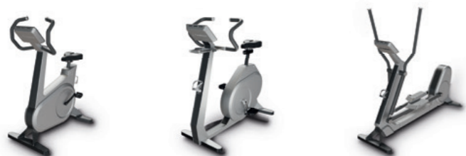
Q Bike Q Bike LE Q Crosstrainer