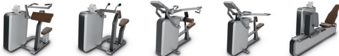
Q Biceps Curl Q Triceps Extension Q Lat Pulldown Q Shoulder Press Q Leg Press