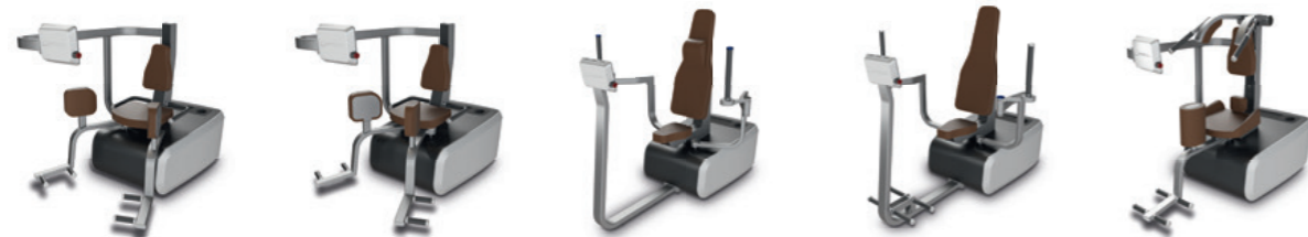
Q Abductor Q Adductor Q Butterfly Q Butterfly Reverse Q Rotator