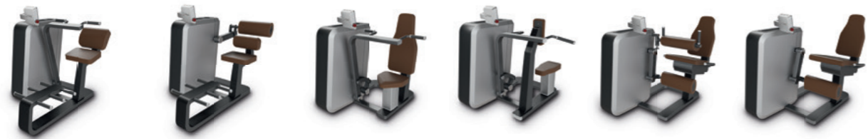
Q Abdominal Crunch Q Back Extension Q Chest Press Q Seated Rowing Q Leg Curl Q Leg Extension