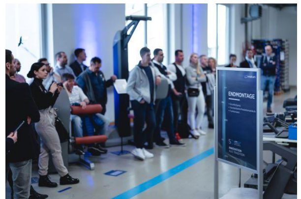
Bild 5: „Made in Emersacker“ - milon Tour durch die Produktionshalle.